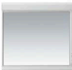
一面鏡 (ベーシックLED)