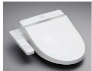
ウォシュレット BV2 TCF2222E