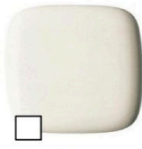
パステルアイボリー