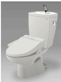
便器 CS370 CFS371BA タンク SH371BA